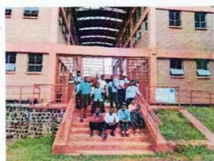
Solar Energy & Ecology Instituut

Op 12 Januari 2026 gaan 13 studenten die hun MSCE examens hebben gehaald starten met een nieuwe spannende uitdaging, 3 1/2 jaar studie op het Solar Energy & Ecology Institute, SEEI.