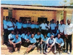
Studenten Chifira School

Vanaf 2026 zal de Malawiaanse regering de totale kosten van de Middelbare scholing op zich nemen.Wij als CBO Mbamba zijn er ongelofelijk blij mee dat dit na onze steun van velen jaren gerealiseerd kan worden.