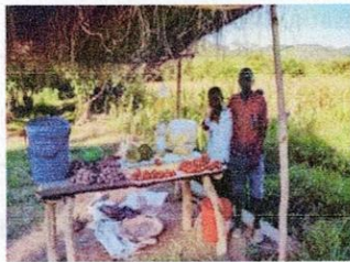
Het dagelijkse voedsel

Vanwege devaluaties,klimaat verandering verloren productie zoals b.v van mais,Forex tekort daardoor invoer kosten hoog,brandstof tekort en/of brandstof prijs stijging daardoor de prijzen van goederen omhoog, Deze zijn een paar van de oorzaken dat velen families geforceerd worden om zich maar 1 maaltijd per dag te kunnen veroorloven en zich de basis benodigheden amper of niet kunnen bekostigen.